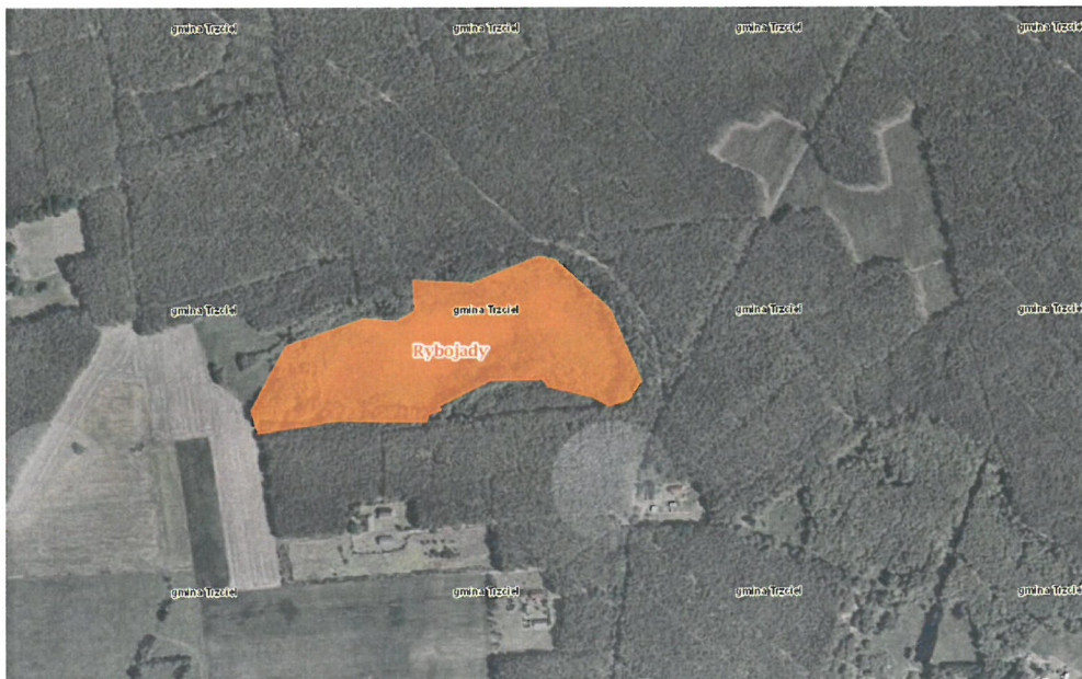
Mapa lokalizacji rezerwatu przyrody „Rybojady”

2.1. Usługa polegająca na wykonaniu działania ochronnego w rezerwacie przyrody „Rybojady”, tj. wycięciu nalotów roślinności drzewiastej i trzciny z powierzchni 2 ha (Nadleśnictwo Trzciel, Leśnictwo Bolków, oddz. 21d) wraz z zapewnieniem wywozu pozyskanej biomasy poza obszar rezerwatu.