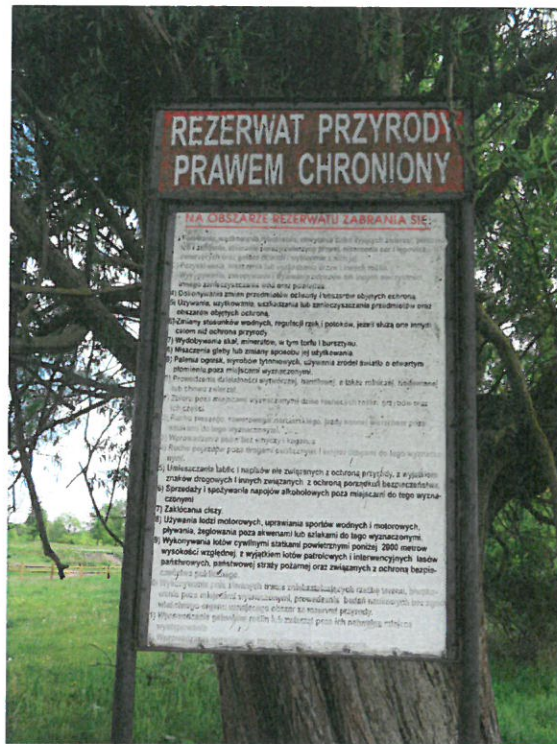
Zdjęcia poglądowe części tablic i stelaży przeznaczonych do demontażu i utylizacji