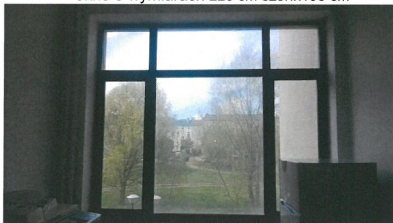
okno o wymiarach 220 cm szer.x195 cm