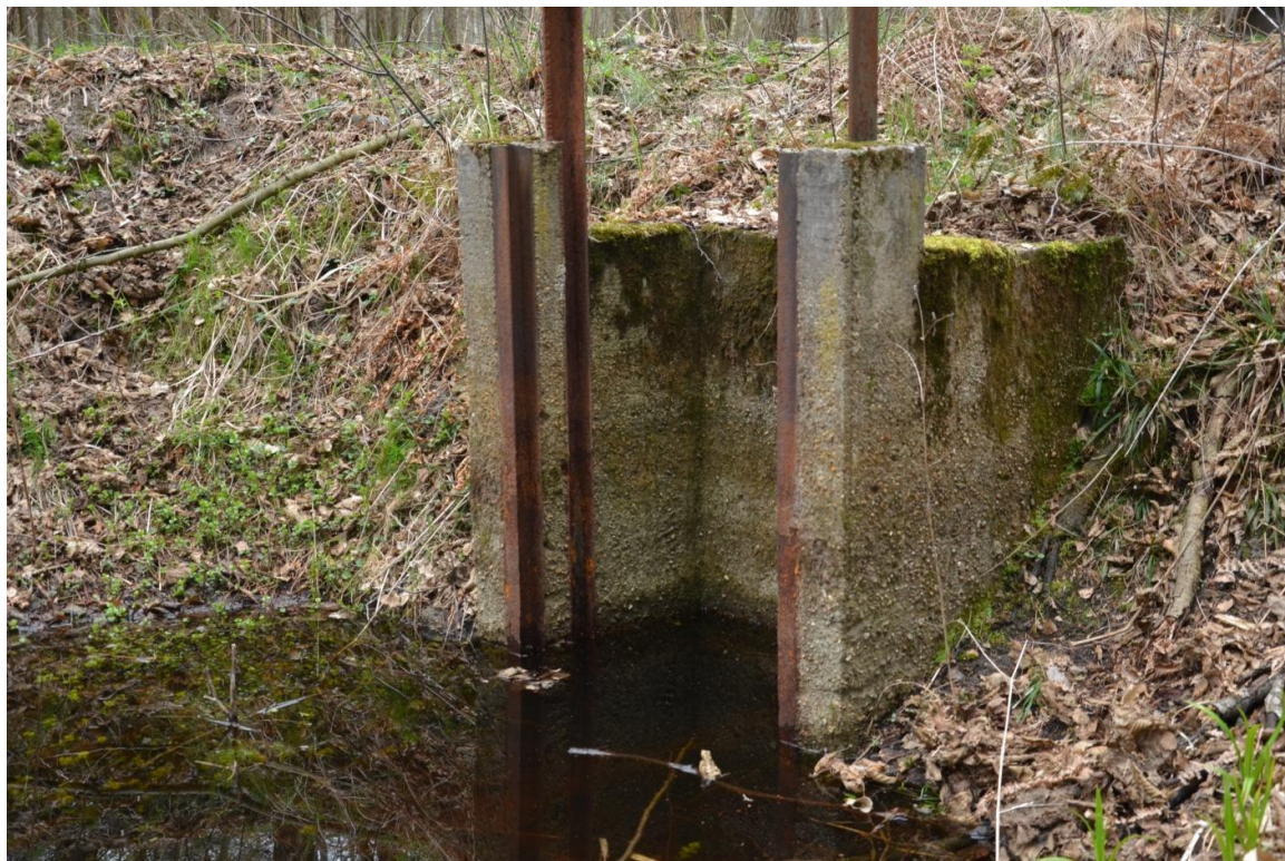
Zdjęcia mnicha w obszarze Natura 2000 Diabelski Staw koło Radomicka PLH 080056